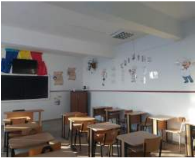
Săli de clasă